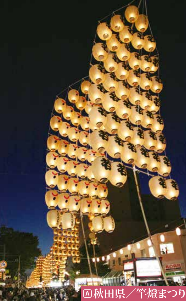
【A】秋田県／竿燈まつり