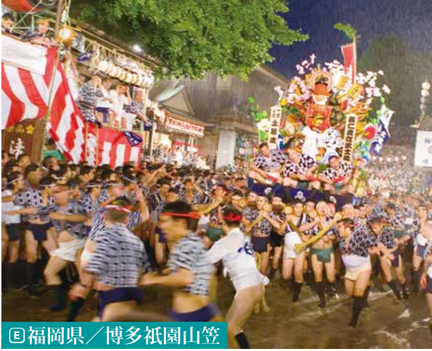
【E】福岡県／博多祇園山笠