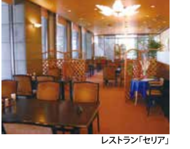
レストラン「セリア」