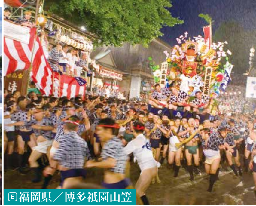
【E】福岡県／博多祇園山笠