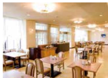
レストラン「ワカシオ」