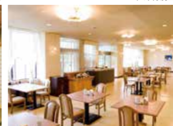
レストラン「ワカシオ」