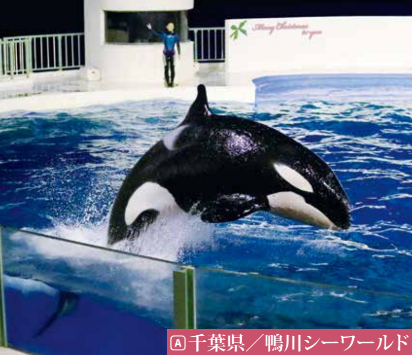
A 千葉県／鴨川シーワールド