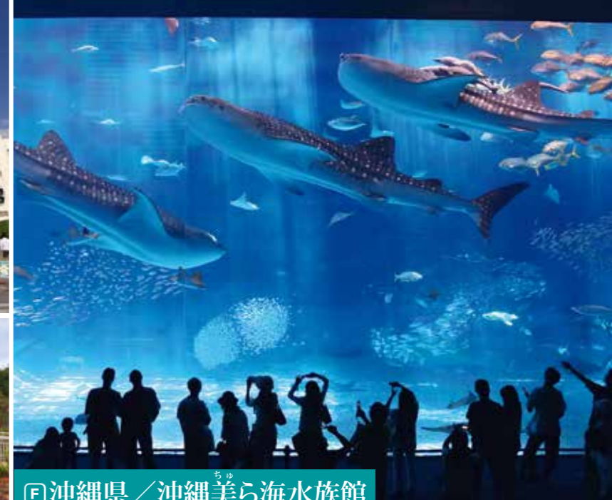
F 沖縄県／沖縄美ら海水族館